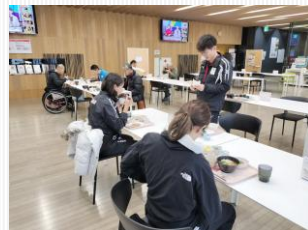
NTCイーストの食堂 (ピュッフェ形式)