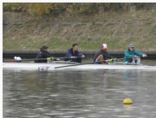
戸田コースで練習するMix4+クルー