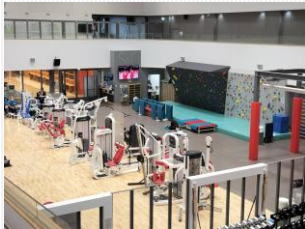
NTCイーストのトレーニングジム

パラローイング日本チームは、NTC(National Training Center)・戸田漕艇場他で12月強化合宿を行いました。障がい者用設備の整ったNTCイースト棟内のジムにて、トレーナーより指導を受け、来シーズンに向けて身体づくりのためのウェイトトレーニングに取り組みました。加えてPR3選手は、戸田コースにて乗艇練習も行い、来年のパリ大会予選に向け技術課題の改善に取り組みました。また、本年3月に続き、東京大学大学院野崎研究室のご協力を得て、各選手のローイング動作解析を行い、個々の動作の傾向を明らかにしました。